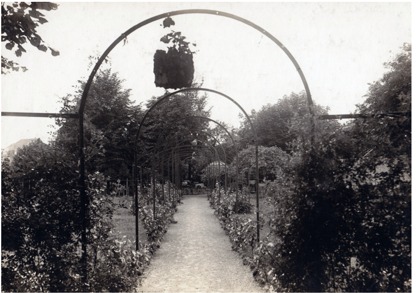
Der Weg durch ein Rosenspalier zur Gartenwirtschaft um 1900