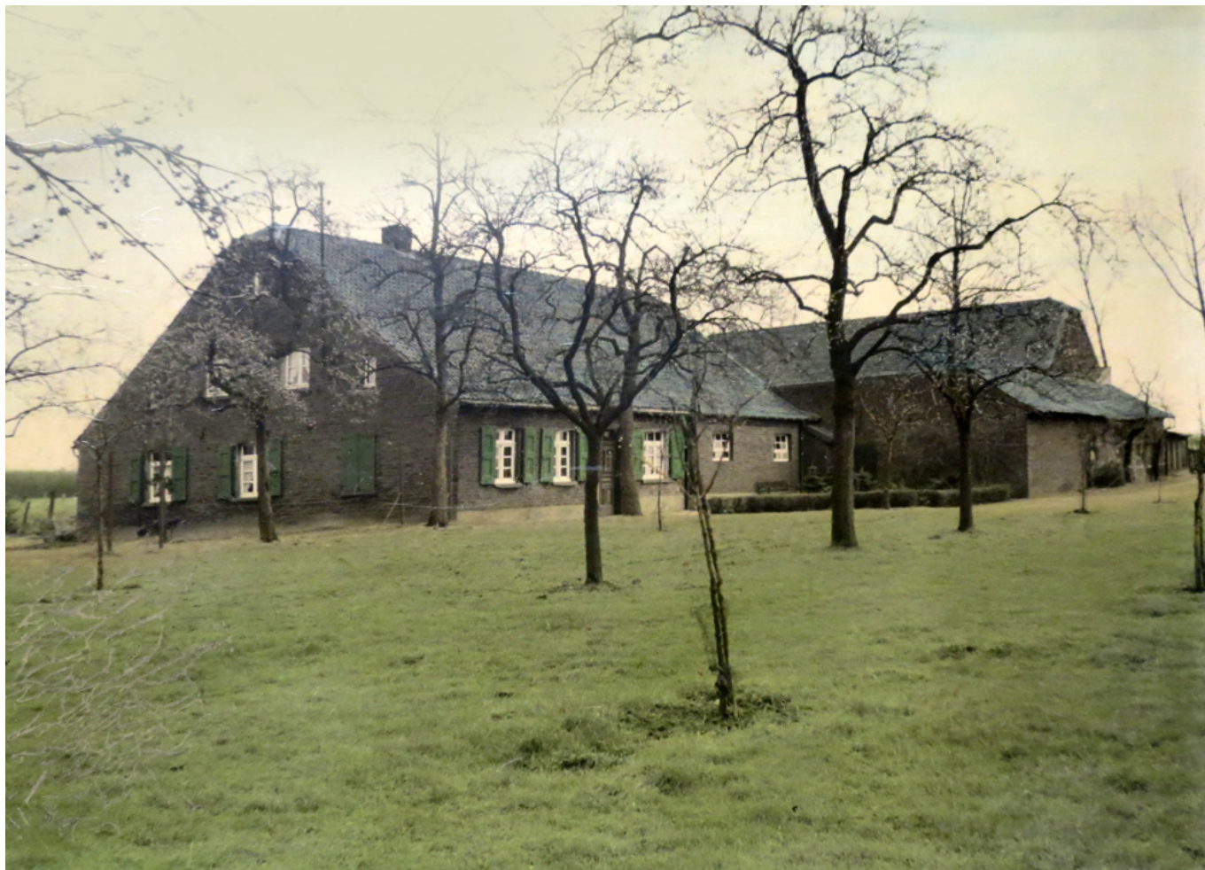
Der Winkelter Hof vor seinem Abriss Ende der 1960er-Jahre

Namensgeber der Straße ist der ehemalige, inzwischen mit Wohnhäusern überbaute Winkelter Hof. Der Winkelter Hof gehörte mit zu den ersten im Broicherdorf als Bruchrand Hof errichteten Bauernhöfe. [2]